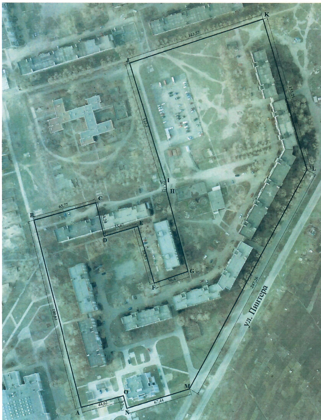
Схема границ территории, на которой осуществляется территориальное общественное самоуправление «Текстильщик-1»

Приложение к решению Донецкого городского совета Донецкой Народной Республики от 18.12.2025 № I/70-4